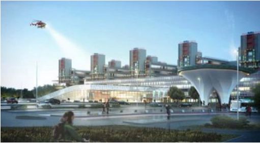
Rendering des mit dem Neubau entstehenden neuen Haupteingangs

Grundlage bildete der gemeinsam mit dem Büro Henn im Jahr 2017 als Gewinner abgeschlossene Wettbewerb für das Projekt. des Im Rahmen dieses Projektes werden unter anderem 36 neue OP's errichtet